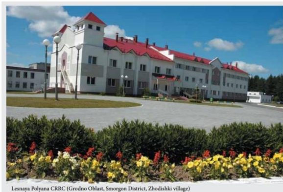
ベラルーシのサナトリウム

ベラルーシ共和国では1ミリシーベルト以下の汚染地域地域でも、その子どもたちは、サナトリウムでの保養が保証されています。それが国の責任だからです。（チェルノブイリ法） りんごの森はボランティアの力でできた保養所です。しかし本来は公的責任で行われるべきです。