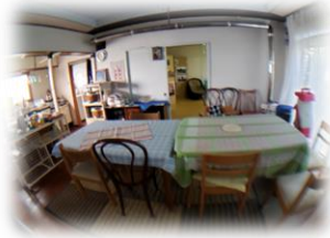
居間とキッチン（左）

●りんごの森 鍋・食器類・調味料 （自然食）常備。米、 肉は要望に応じてご 用意します。